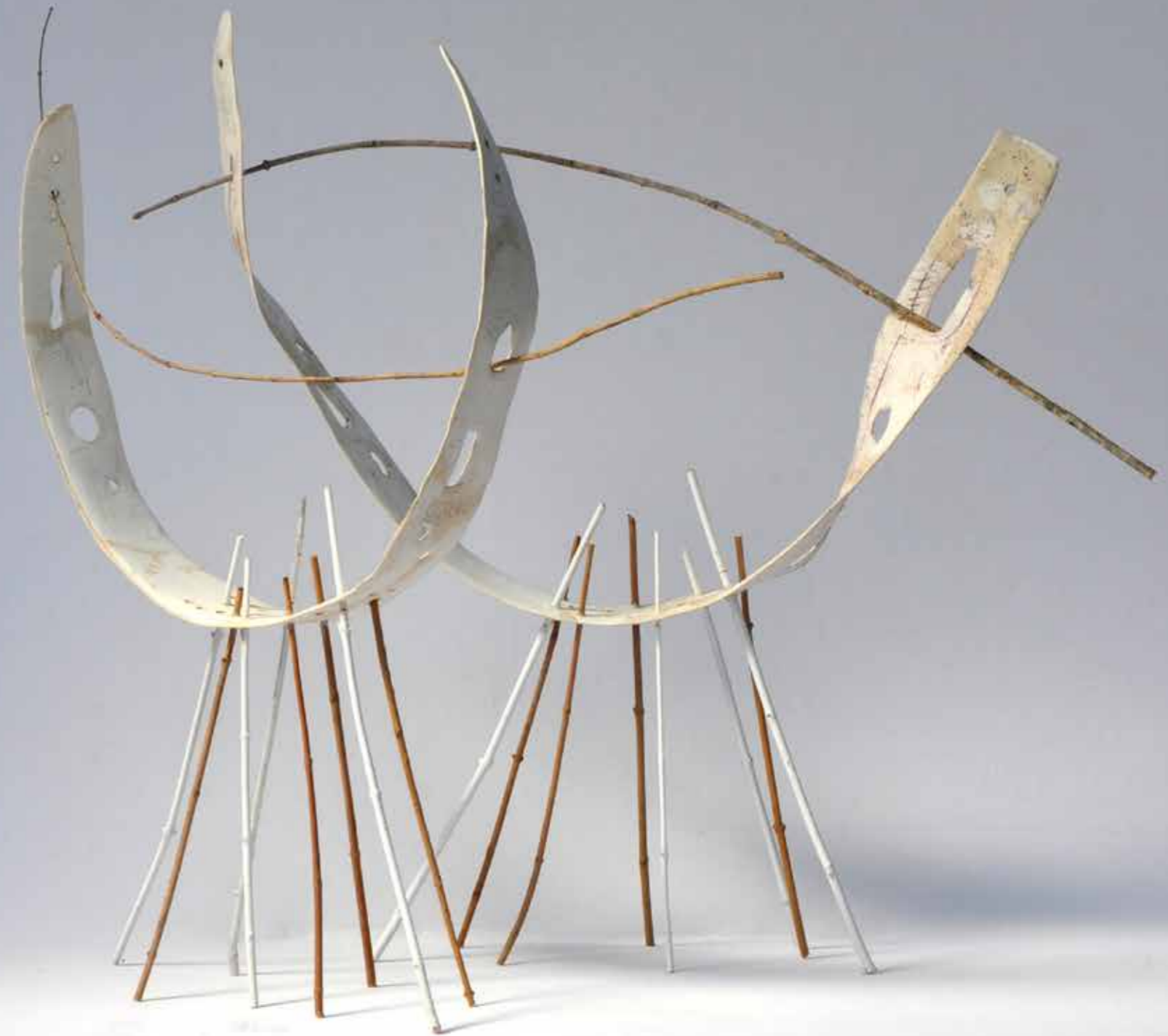
BIANCA SUSY PIVA / L'AMORE SOSPESO PER CREATURE INDEFINITE / 2021 Paperclay, porcellana, rami di noce – dimensioni massime H 70cm L 70